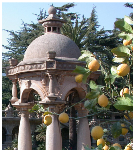
Villa Grock - Imperia

Vasta proprietà dominata da una torre tardo medievale, è fulcro di un sistema agricolo antico tra olivi e vigne, che nel tardo Ottocento viene trasformato in un interessante parco ricco di esemplari esotici.