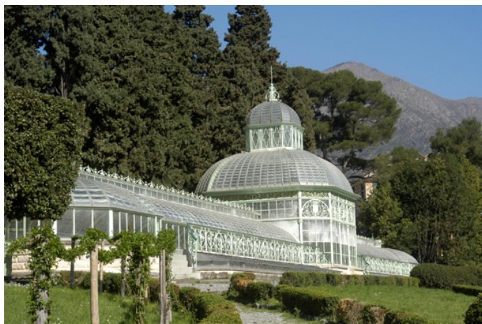
Villa Negrotto Cambiaso – Arenzano GE

Sculture di Beuys, Rotella, Pomodoro, Fontana, Spoerri, Thun e moltissimi altri dialogano tra felci, oleandri, monumentali camelie con un affascinante Parco creato agli inizi del Novecento a picco sul golfo di Portofino.