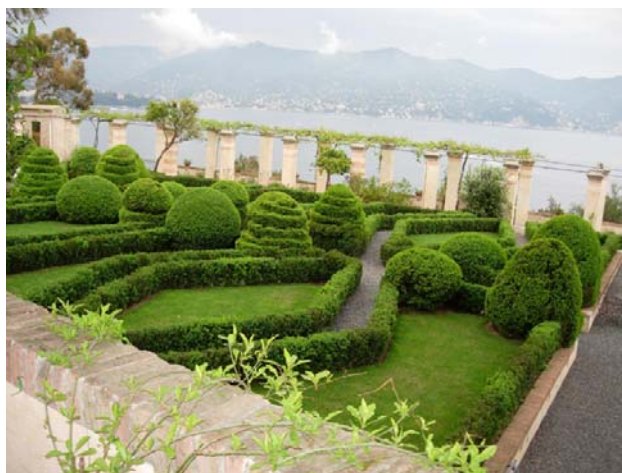
La Cervara , Abbazia di San Girolamo al Monte di Portofino

Con la sua sagoma candida dominante il blu del mare di Bordighera, l'eclettica Villa di Charles Garnier, autore dell'Operà di Parigi, possiede un panoramico giardino ideato da Ludwig Winter, con pregiate essenze mediterranee, esotiche, ed una collezione unica di palme.