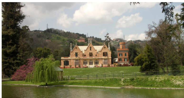
Villa Serra – Sant'Olcese GE

Originale Villa in stile Tudor con vasto parco all'Inglese nel cuore dell'entroterra genovese, di recente completamente restaurati. Il parco possiede la più grande collezione pubblica di ortensie, con oltre 1300 esemplari e 200 varietà.