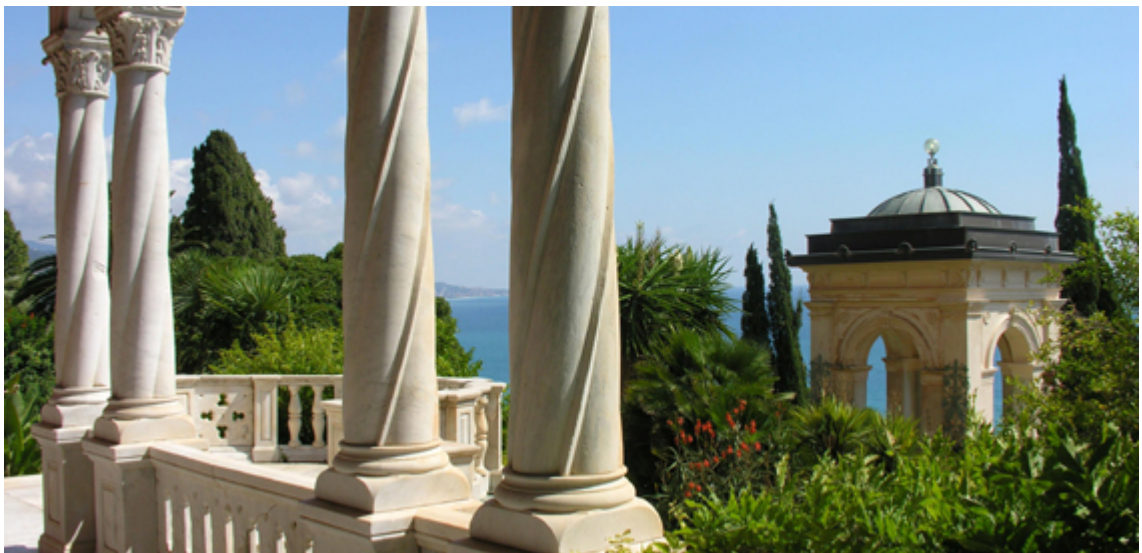
Villa Hanbury – La Mortola Ventimiglia IM

Tra i più bei e famosi giardini botanici di acclimatazione del mondo, collocato lungo una costa mozzafiato, opera dei fratelli Thomas e Daniel Hanbury e del grande paesaggista Ludwig Winter.