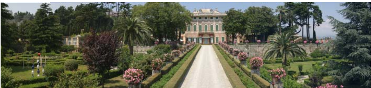
Villa Faraggiana, Albissola Marina SV

Periodi consigliati di visita: da primavera ad autunno inoltrato