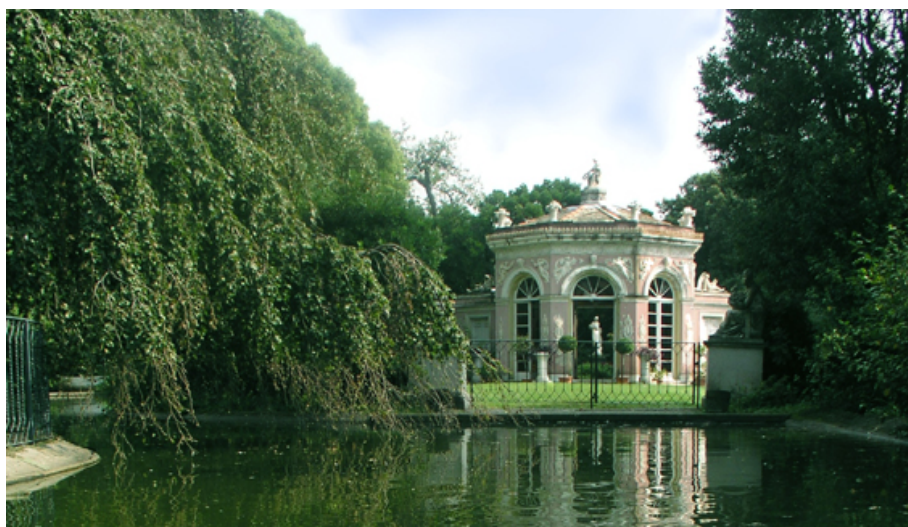
Villa Durazzo Pallavicino – Genova Pegli

Costituito dai giardini di Villa Serra, Grimaldi, Gropallo, Luxoro il complesso è l'area verde più grande di Genova, adibito a polo museale e ricreativo. All'interno si trovano oltre cento specie botaniche di flora mediterranea, cinque alberi monumentali, e un importante roseto.